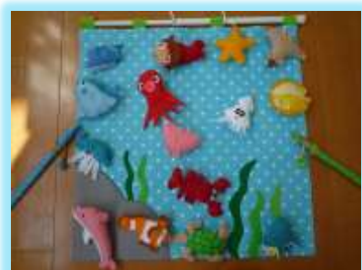
フェルトでつくった さかなつりセット