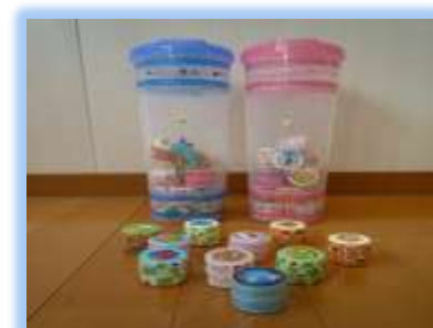
パスタケースとペットボトルの ふたでつくったあなおとし