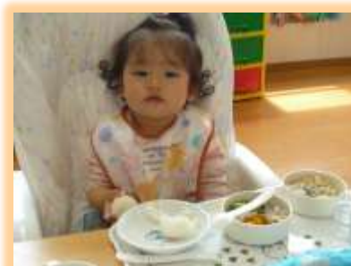
はじめてのきゅうしょく おいしい～