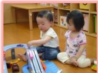
トミカでなかよくあそんで プチデート