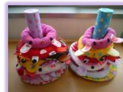
タオルとフェルトでつくった わなげ