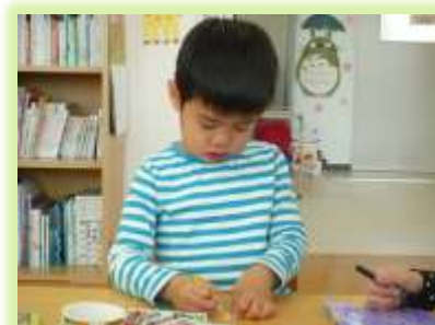
こいのぼりせいさく クレヨンでおえかき